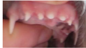
Ab 14 W.: I1i2i3c-p2p3p4 I1i2i3c-p2p3p4