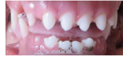
Ca. 15 W.: I1i2i3c...