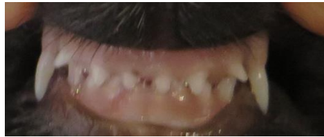
13 W.: noch mehr...