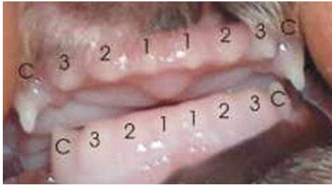
5 W.: ---c-----