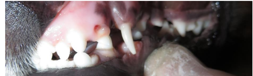
Ca. 4 M.: I1I2I3cP1p2p3p4