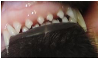
12W.: i rücken auseinander