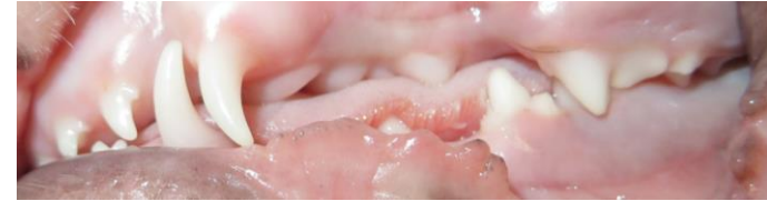
8-11 W.: i1i2i3c- (p2)p3p4- i1i2i3c-p2p3--