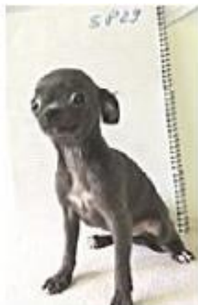
Kira 168-18 gestorben