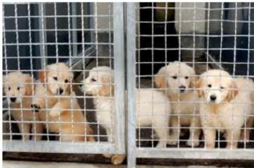
Auch diese Golden-Retriever-Welpen wurden aus dem Transport gerettet.

Von Mathias Bury 15. Mai 2018 - 18:25 Uhr