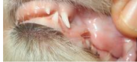
5-6 W.: i1i2i3c-(p2p3p4)